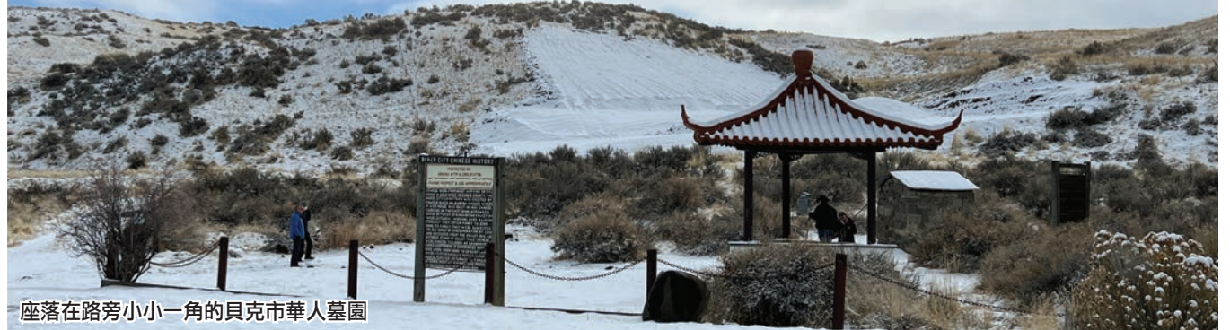
座落在路旁小小一角的貝克市華人墓園