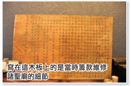
寫在這木板上的是當時籌款維修諸聖廟的細節

上，有34名在俄勒岡淘金的華工被虐殺，七名白人暴徒拿走了華工用生命換回來的黃金沙子。據說每個華工擁有至少當時市值五千元以上的金沙。最後兇手被捕，但卻無罪釋放，更被當地人奉為“英雄”。