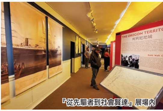
『從先驅者到社會賢達』展覽內