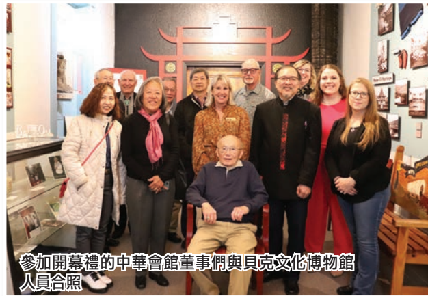
參加開幕禮的中華會館董事們與貝克文化博物館人員合照