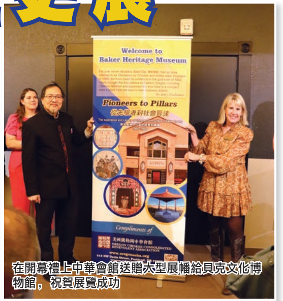
在開幕禮上中華會館送贈大型展幅給貝克文化博物館，祝賀展覽成功