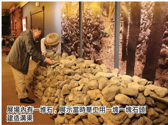
展覽內有一堆石，展示當時華工用一塊一塊石頭建造溝渠