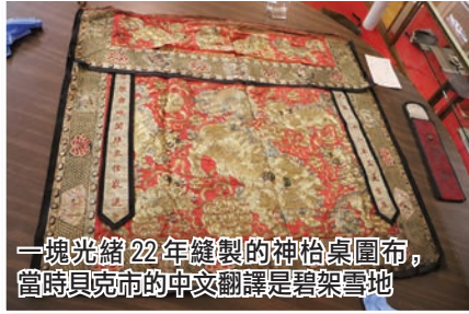
一塊光緒22年鑄製的神拾桌圍布，當時貝克市的中文翻譯是碧架雪地