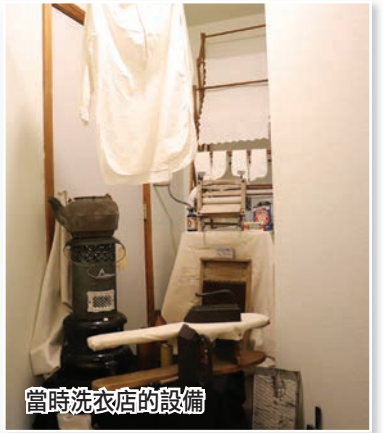
當時洗衣店的設備