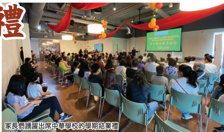
家長們踴躍出席中華學校的學期結業禮

中華學校逢星期六上午在波特蘭社區學院內上課，課程分有5班，學生的年齡有由學前班的都大學生，他們所讀的級別是按中文程度而分班的，下學年將於9月9日開課，家長們請留意即將公佈的報名詳情。