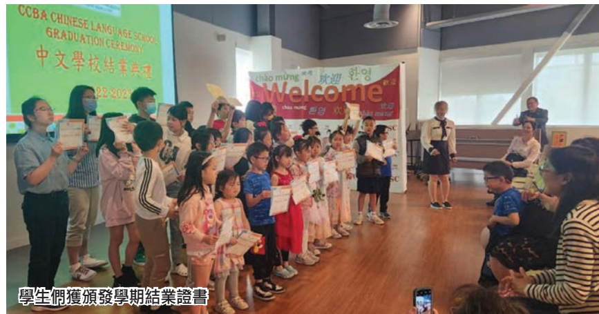
學生們獲頒發學期結業證書