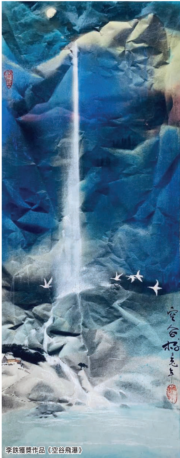
李鐵獲獎作品《空谷飛瀑》