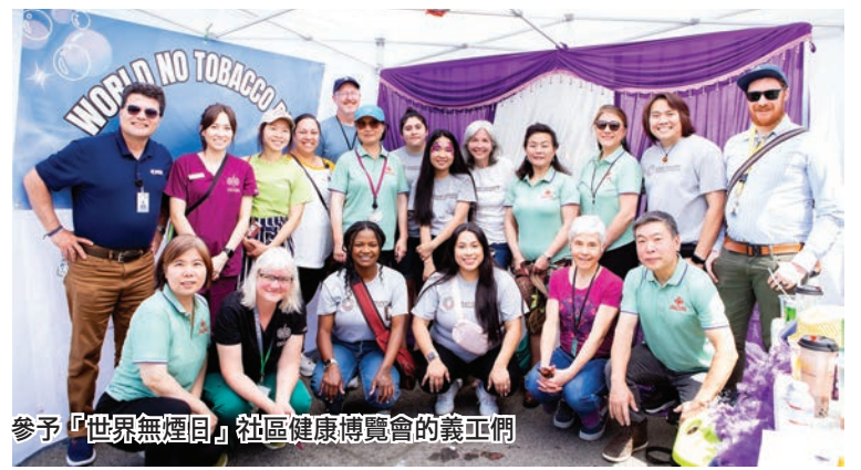
參與「世界無煙日」社區健康博覽會的義工們

活動從上午10時，在中國聯誼會龍獅隊舞龍舞獅的鑼鼓聲中開啓，直至下午2時結束，自始至終