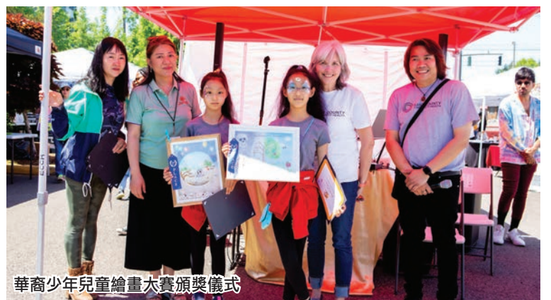
華裔青少年兒童繪畫大賽頒獎儀式

川流不息，氣氛熱烈，取得了活動的預期效果。「通過與受人尊敬的組織和社區合作夥伴的聯手，以致力於提高人們對吸煙危害的認識和行動，我們相信知識給予的力量，我們決心讓個人能夠就自己的健康做出明智的選擇和決定，讓戒煙活動更加顯著和發展。」本次博覽會合作方總監Lung Wah在講話中作了以上表述。