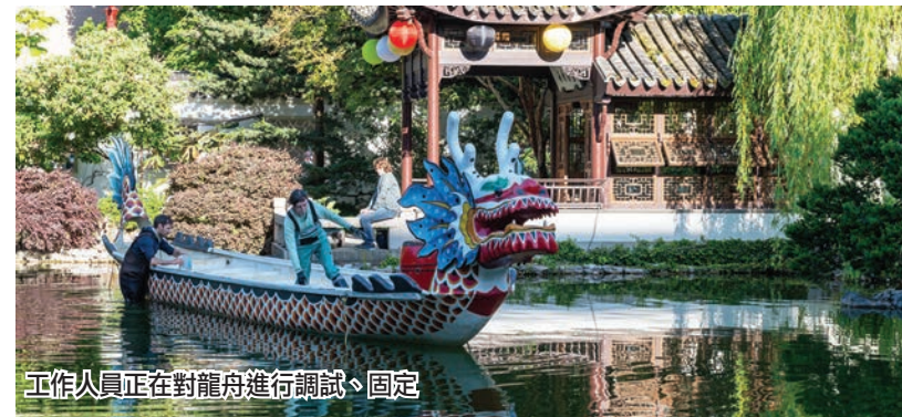
工作人員正在對龍舟進行調試、固定

(上接A1版) Venus Sun認為，展示端午節傳統文化最好的方式就是將真實的龍舟帶入活動現場，盡可能讓遊客近距離感受中國傳統龍舟文化，了解端午節的歷史內涵與屈原的故事。園內懸掛五色彩燈，就是寓含中國民間人們於端午節期間佩戴五彩絲線的傳統習俗。