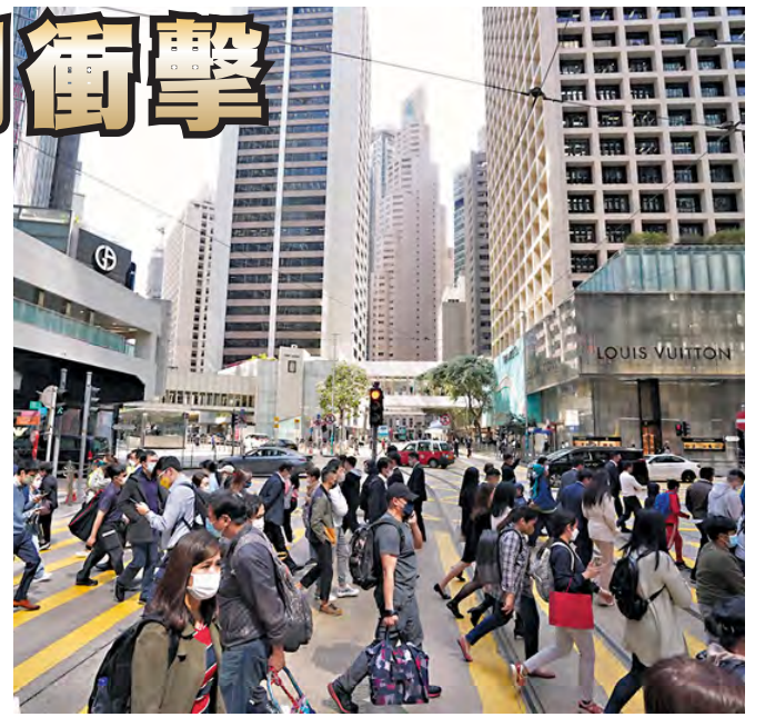
5月公佈擴大「人才清單」涵蓋的專業範疇由13項增至51項，他歡迎政府措施，期待有助本港紓緩人才短缺。

梁兆基引述調查結果指，59%受訪公司反映最缺人手的工種年均底薪為20萬至50萬元，反映勞動市場尤其缺乏初級至中層職位。梁表示，調查在4月進行，政府則在