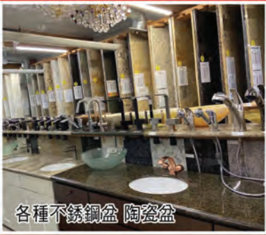
各種不銹鋼盆 陶瓷盆