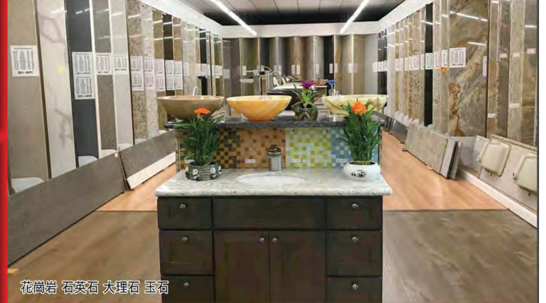
花崗岩 石英石 大理石 玉石