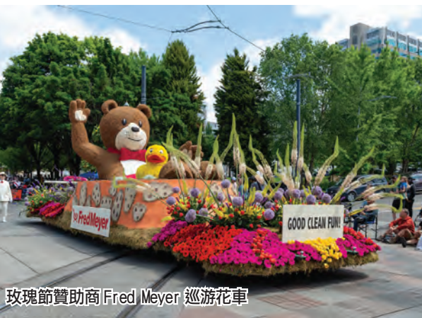
玫瑰節贊助商Fred Meyer 巡遊花車

區域、不同背景、不同族裔之間的溝通與友誼。這是除受疫情影響之外，西北華人聯合會連續十三年組織巡遊隊參加玫瑰節花車大巡遊活動。