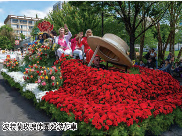
波特蘭玫瑰使團巡遊花車