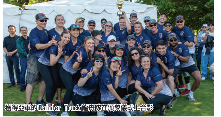
獲得亞軍的Daimler Truck龍舟隊在頒獎儀式上合影