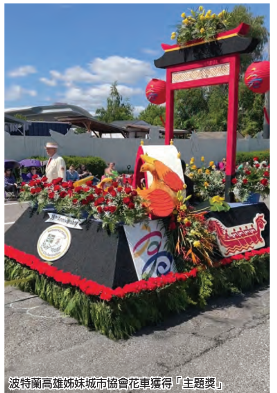
波特蘭高雄姊妹城市協會花車獲得「主題獎」