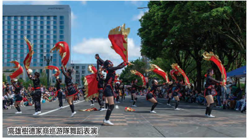
高雄樹德家商巡遊隊舞蹈表演