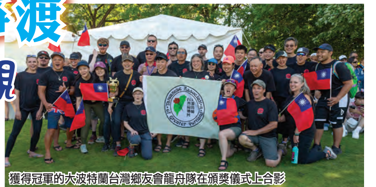
獲得冠軍的大波特蘭台灣鄉友會龍舟隊在頒獎儀式上合影