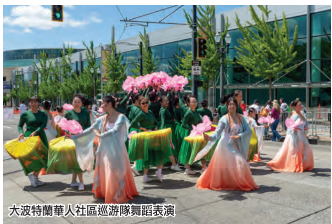
大波特蘭華人社區巡遊隊舞蹈表演