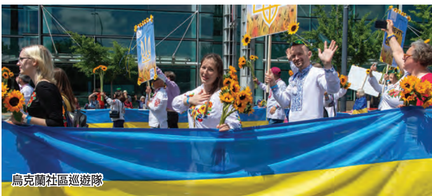
烏克蘭社區巡遊隊