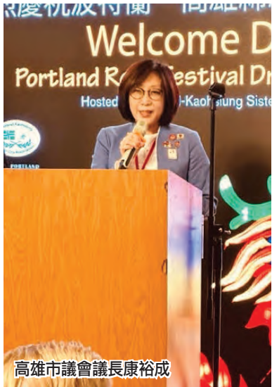
高雄市議會議長康裕成