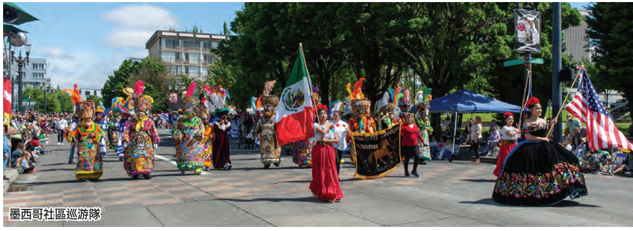
墨西哥社區巡遊隊