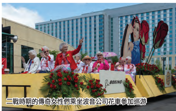
二戰時期的傳奇女性們乘坐波音公司花車參加巡遊