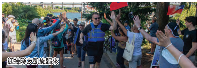
迎接隊友凱旋歸來