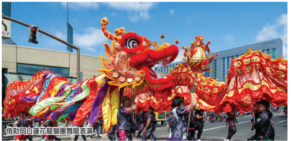
俄勒岡白蓮花龍獅團舞龍表演

他們表示，這不僅能夠增加當地民眾對中華文化的了解，也為華人社區提供了一個展示自身文化與風采的平台，以增進不同