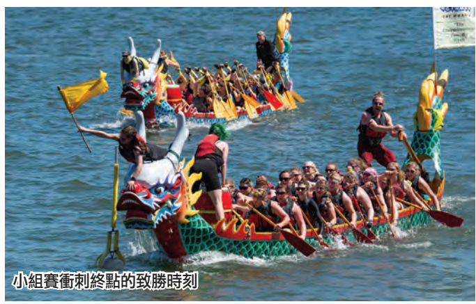
小組賽衝刺終點的致勝時刻

畫面顯示，大波特蘭台灣同鄉會龍舟隊是在最後二十多秒鐘反超友隊並保持領先位置，最終以超出第二名0:03.09的優勢奪得冠軍的。