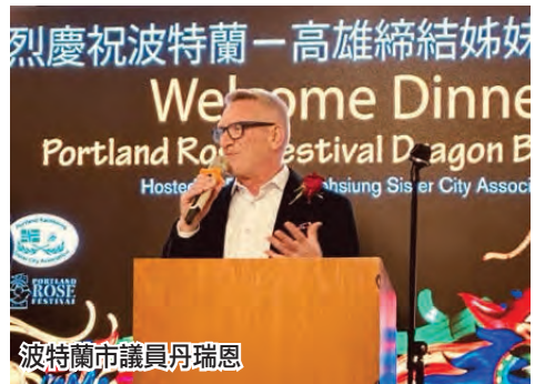
波特蘭市議員丹瑞恩