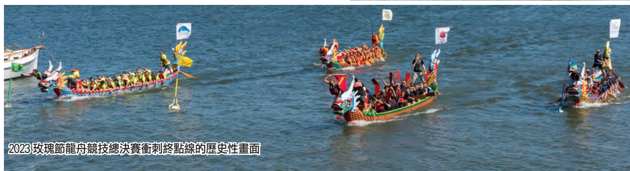
2023玫瑰節龍舟競技總決賽衝刺終點線的歷史性畫面