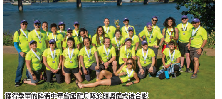
獲得季軍的砵崙中華會館龍舟隊於頒獎儀式後合影