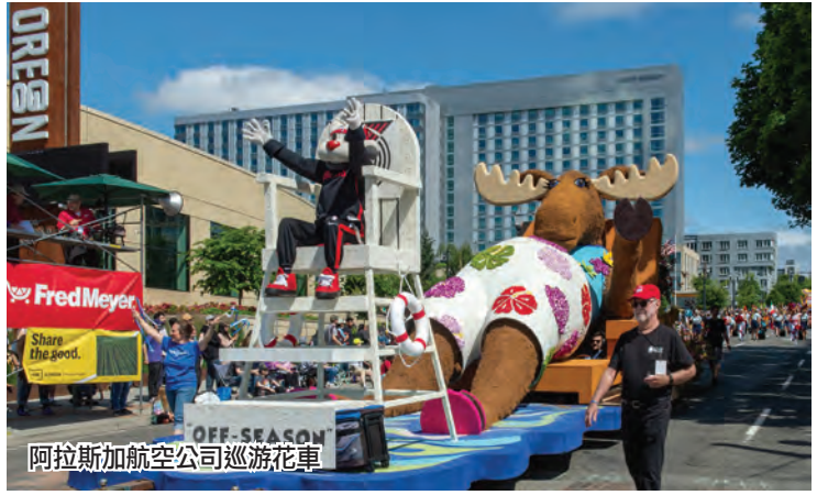
阿拉斯加航空公司巡遊花車