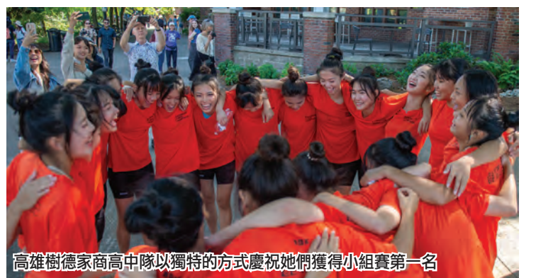
高雄樹德家商高中隊以獨特的方式慶祝她們獲得小組賽第一名