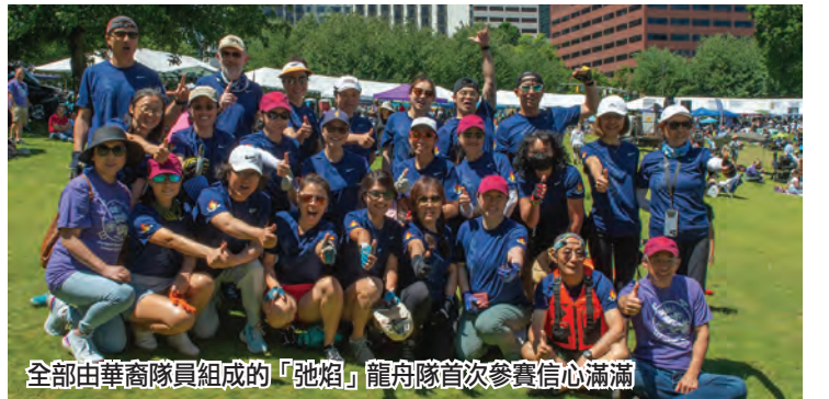
全部由華裔隊員組成的「弛焰」龍舟隊首次參賽信心滿滿