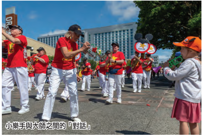
小樂手與大師之間的「對話」

波特蘭玫瑰節花車巡遊始於1907年，百多年來的玫瑰節慶祝活動，展示了波特蘭市悠久歷史的文化傳承和亮麗的現代都市風彩。