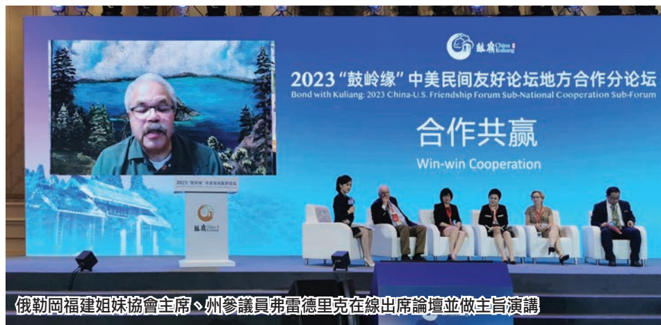
俄勒岡福建姐妹協會主席、州參議員弗雷德里克在線出席論壇並做主旨演講

中國國家主席習近平向「鼓嶺緣」中美民間友好論壇致賀信，為推進中美民間交流發出了積極的信號。