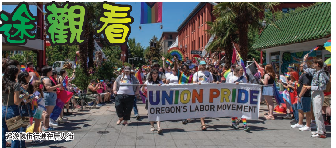
巡遊隊伍行進在唐人街

據了解，由於波特蘭目前的治安狀況令人擔憂，各項開支不斷增加，今年巡遊的保險費用相應上漲了20%。所幸巡遊當天安保措施比較嚴密，疑有安全隱患的路口均用重型卡車設置路障，陽光普照之下巡遊活動平安且順利。