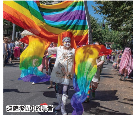
巡遊隊伍中的舞者