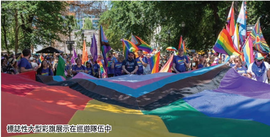
標誌性大型彩旗展示在巡遊隊伍中

主辦單位表示，他們的使命是鼓勵和積極支持女同性戀、男同性戀、雙性戀和變性者的多樣性的社區，並通過教育，協助全體人民的發展這個活動。