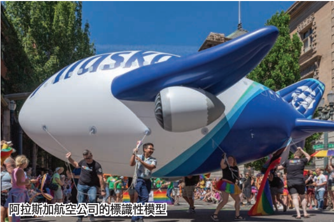
阿拉斯加航空公司的標識性模型