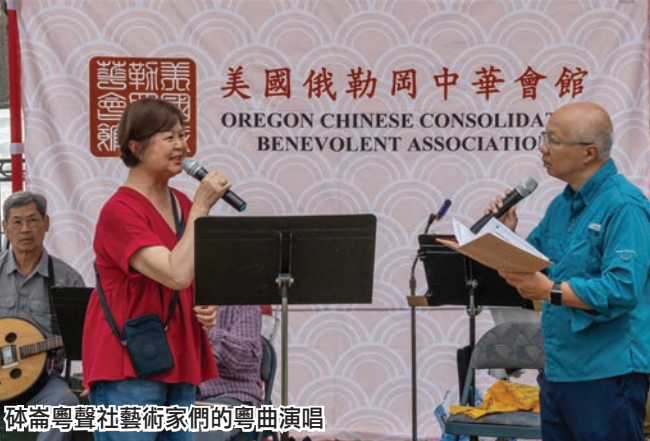
砵崙粵聲社藝術家們的粵曲演唱