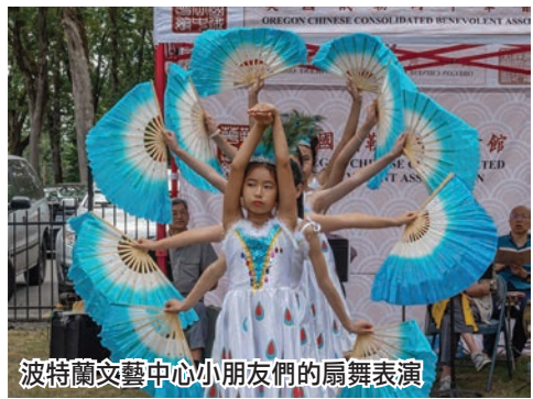
波特蘭文藝中心小朋友們的扇舞表演