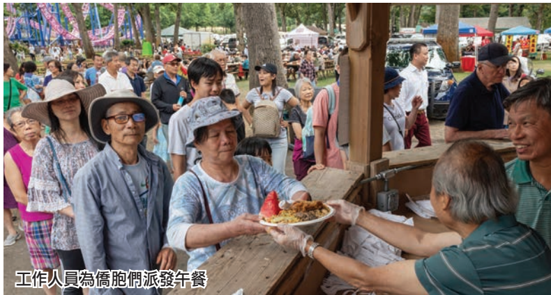
工作人員為僑胞們派發午餐