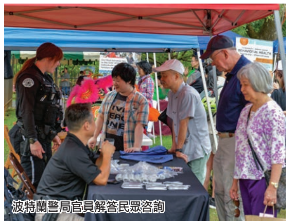
波特蘭警局官員解答民眾諮詢