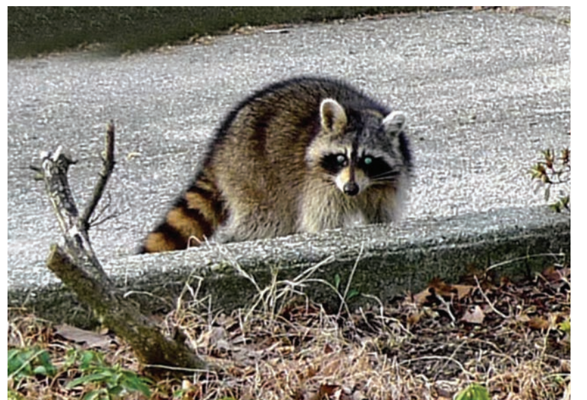
而且強制性遷徙同樣會導致種族數量降低。

至於“魚類和野生動物部(ODFW)”則表示，他們會在必要時，為動物注射安樂死藥劑，但是不會抓捕動物的。ODFW說，他們不能將浣熊遷徙，因為這會傳播野生襲擊與病