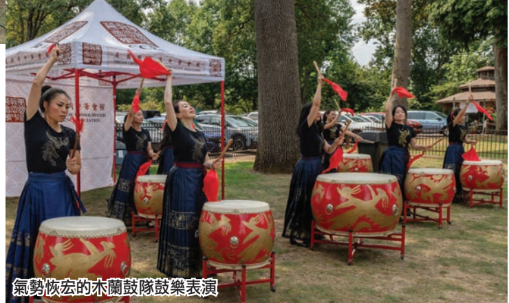
氣勢恢宏的木蘭鼓隊鼓樂表演