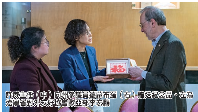
許威主任(中)向州參議員德蒙布羅(右)贈送紀念品。左為遼寧省對外友好協會歐亞部李宏鵬

氣候智能型農業是聯合國糧食與農業組織戰略目標下的十一項資源籌劃合作領域之一，其主要目標是：一、