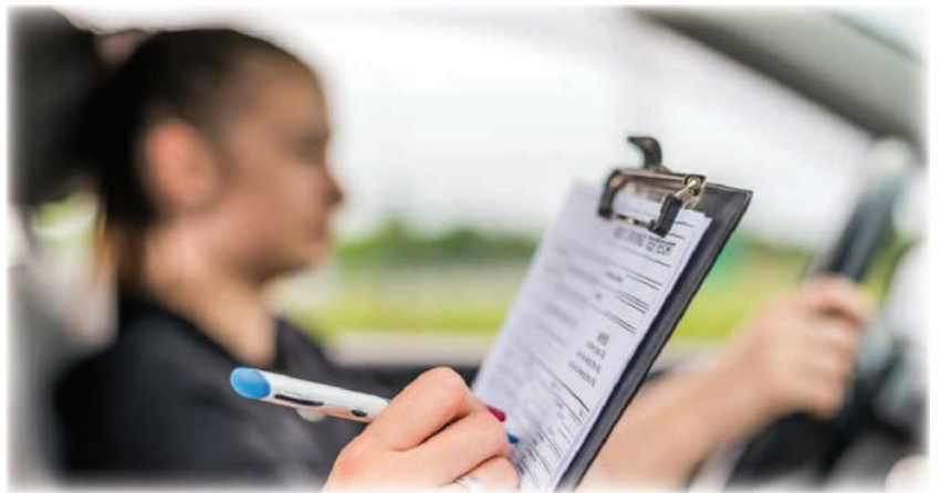
收取的費用僅為9美元，這也就是為什麼這次要提高到45美元。

俄勒岡州DMV所收取的法定費用未能跟上提供服務的實際成本。在過去的20年中，大多數DMV費用的增加都用於城市、縣和州各級的交通項目，而不是用於DMV營運成本。例如，駕駛技能測驗的提供需要大量人力，每次DMV的道路考試的測驗成本為123美元，但在價格調整前，向考生