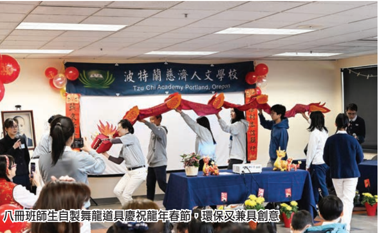
八冊班師生自製舞龍道具慶祝龍年春節，環保又兼具創意

這次春節活動以分站遊戲的方式進行，項目包括竹竿舞、跳格子、春聯對對碰、剪紙燈籠、創意春聯拓印、伸縮小龍、應景食物、吉祥話大挑戰、龍年小圓章，外加兩個由高年級學生主導的特別站：九冊班新年習俗展示與問答與十冊班書法春聯現場寫挑戰。總共有十一個分站，每站算一點。每位學生拿到一張集點卡，由家長帶領自己的孩子闖關玩遊戲收集點數。只要完成七個分站遊戲，即可兌換一個精美福袋；如果完成九個分站，還可以再抽一個驚喜禮物。 慈濟人文學校還準備了應景的傳統發糕、素春捲、水果和茶水，提供大家取用。當天全校師生家長與志