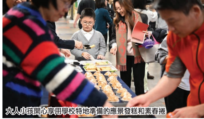
大人小孩開心享用學校特地準備的應景發糕和素春捲

工，參加人數將近200人，慶祝活動在下午三點鐘圓滿結束，大人小孩都覺得這次的活動溫馨熱鬧，充滿濃厚的過年氣氛，分站遊戲也設計得活潑有趣，有吃有玩還有禮物拿。散場前小朋友還獲贈一顆龍年氣球帶回家，大家滿心歡喜期待龍年更美好的每一天。(紀錄：黃靜妍)