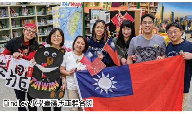
Findley小學臺灣志工群合照