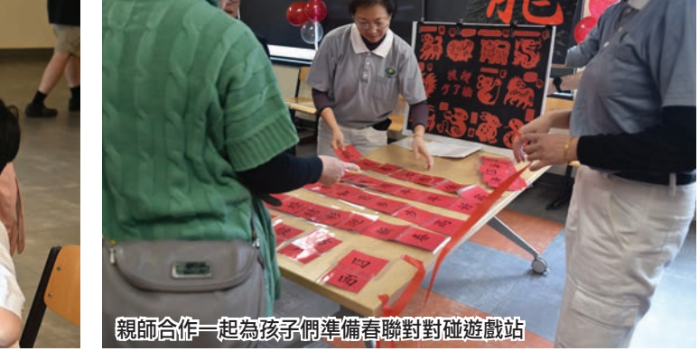
親師合作一起為孩子們準備春聯對對碰遊戲站