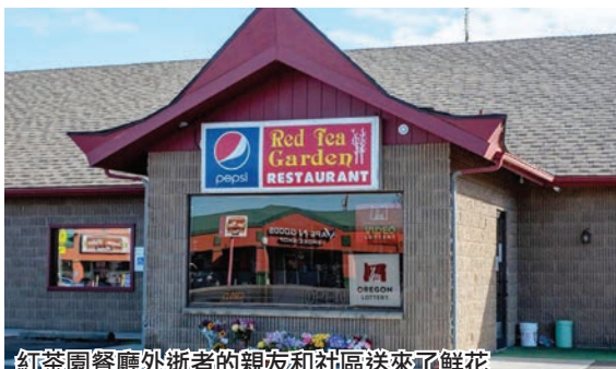
紅茶園餐廳外逝者的親友和社區送來了鮮花