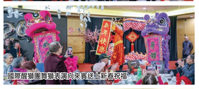
國際醒獅團舞獅表演向來賓送上新春祝福