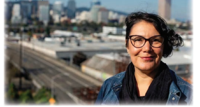
徵多少稅！」可見，不少民眾都存在著對政府資金管理、政策執行和政府官員的不信任和不滿的情緒。

此消息一出，立即引發網友不滿。有網友批評，當局就像是個拿著大信用卡、花錢無度的小孩。還有網友指出，這些做法都沒有效果，只有讓非法藥物再次非法才行得通。還有網友直呼精彩，「愚蠢的民主黨人從不會讓人失望」。更有網友直接發問：「你就告訴我多