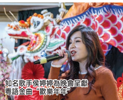
知名歌手侯婷婷為晚會呈獻粵語金曲“歡樂年年”