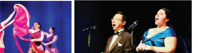
歌曲《我像雪花天上來》