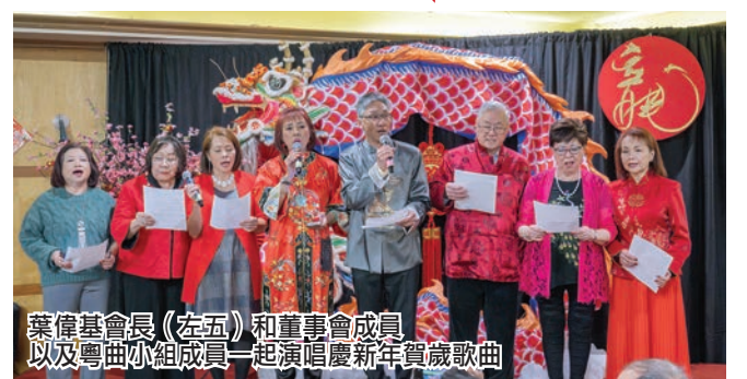
葉偉基會長(左五)和董事會成員以及粵曲小組成員一起演唱慶新年賀歲歌曲