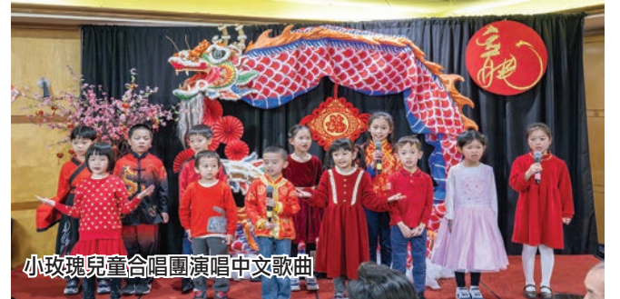
小玫瑰兒童合唱團演唱中文歌曲