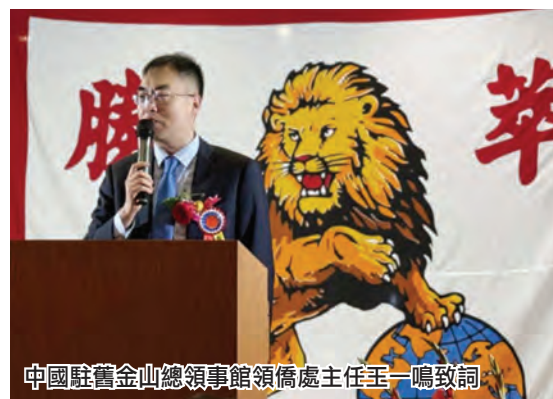
中國駐舊金山總領事館領僑處主任王一鳴致詞