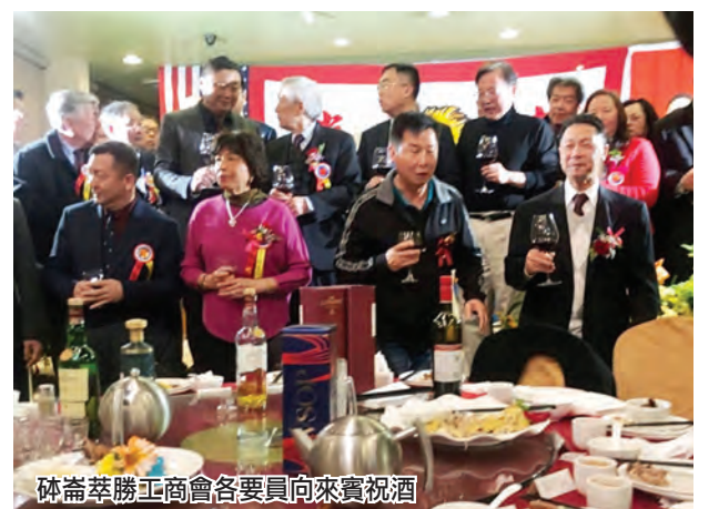
砵崙萃勝工商會各要員向來賓祝酒