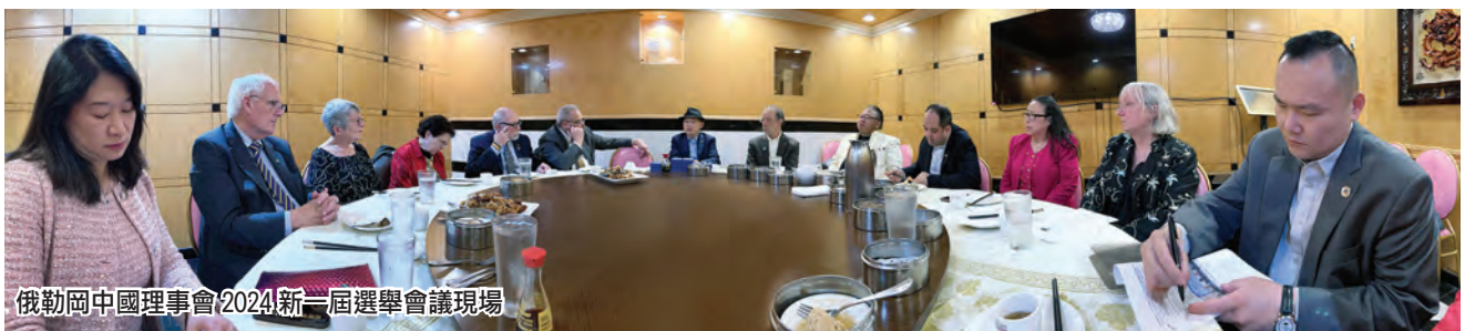
俄勒岡中國理事會(2024)新一屆選舉會議現場

2024年美國青年赴華采風、氣候論壇和人文交流等一系列大型活動，必將進一步體現“中美關係：希望在人民、基礎在民間、未來在青年、活力在地方。”