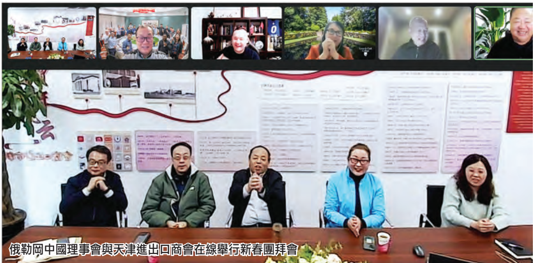
俄勒岡中國理事會與天津進出口商會在線舉行新春團拜會

兩地的老朋友們於新春佳節期間線上相聚、暢敘友情、共話發展，夯實雙方未來持續合作、深入發展友好關係的堅實基礎。