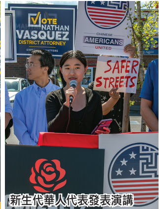
新生代華人代表發表演講