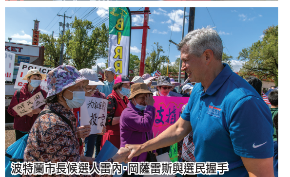
波特蘭市長候選人雷內·岡薩雷斯與選民握手