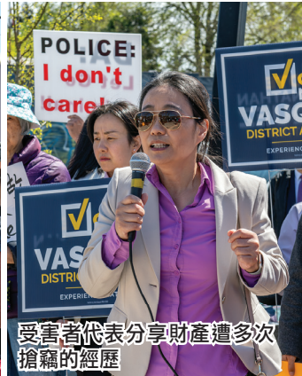
受害者代表分享財產遭多次搶竊的經歷