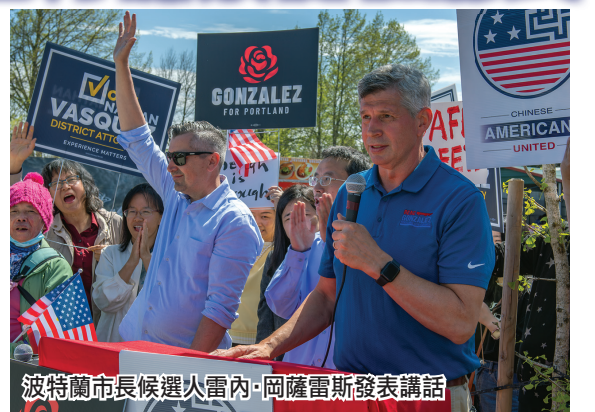
波特蘭市長候選人雷內·岡薩雷斯發表演講

這次集會不僅凝聚了華人社區的力量，更是對當地治安問題的集體呼籲與行動。波特蘭華人社區期待透過積極參政實現社區的安全和繁榮。