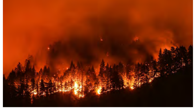
有關申請詳情，請參閱政府官網： https://www.oregon.gov/odhs/emergency-management/Pages/resilience-grants.aspx

當地居民、地方政府、公立學校、美國印第安部落或部落組織、宗教團體、社區組織、非營利組織等，無論是個人還是組織，只要其活動有助於公眾利益並增強社區的力量，都可以考慮申請這項撥款。