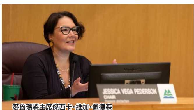
麥魯瑪縣主席傑西卡·維加·佩德森

教育也成為了讀者關注的焦點。一些評論指出，政府專注於為尋求庇護者提供住房，而忽略了教育體系對本地學生的支持。