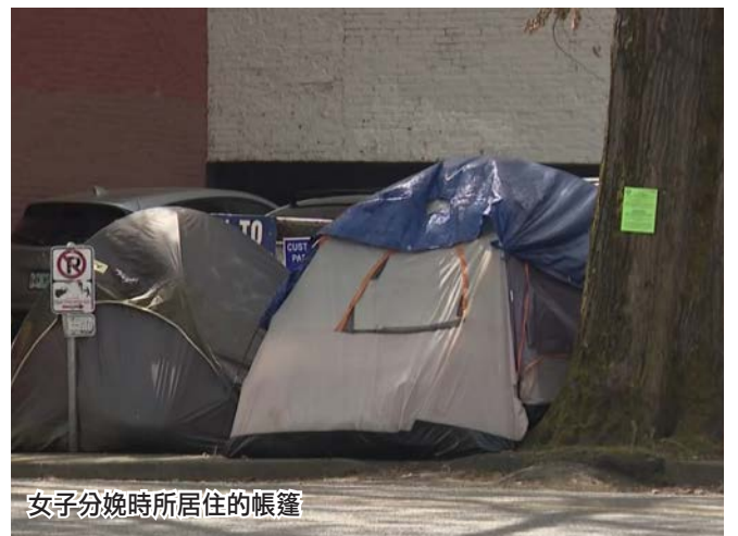
女子分娩時所居住的帳篷

目前，該女子仍然居住在市中心的帳篷裡。營地清理人員已經對她的帳篷張貼了清理通知。另根據報導，她已被列入一個微型房屋的候補名單。