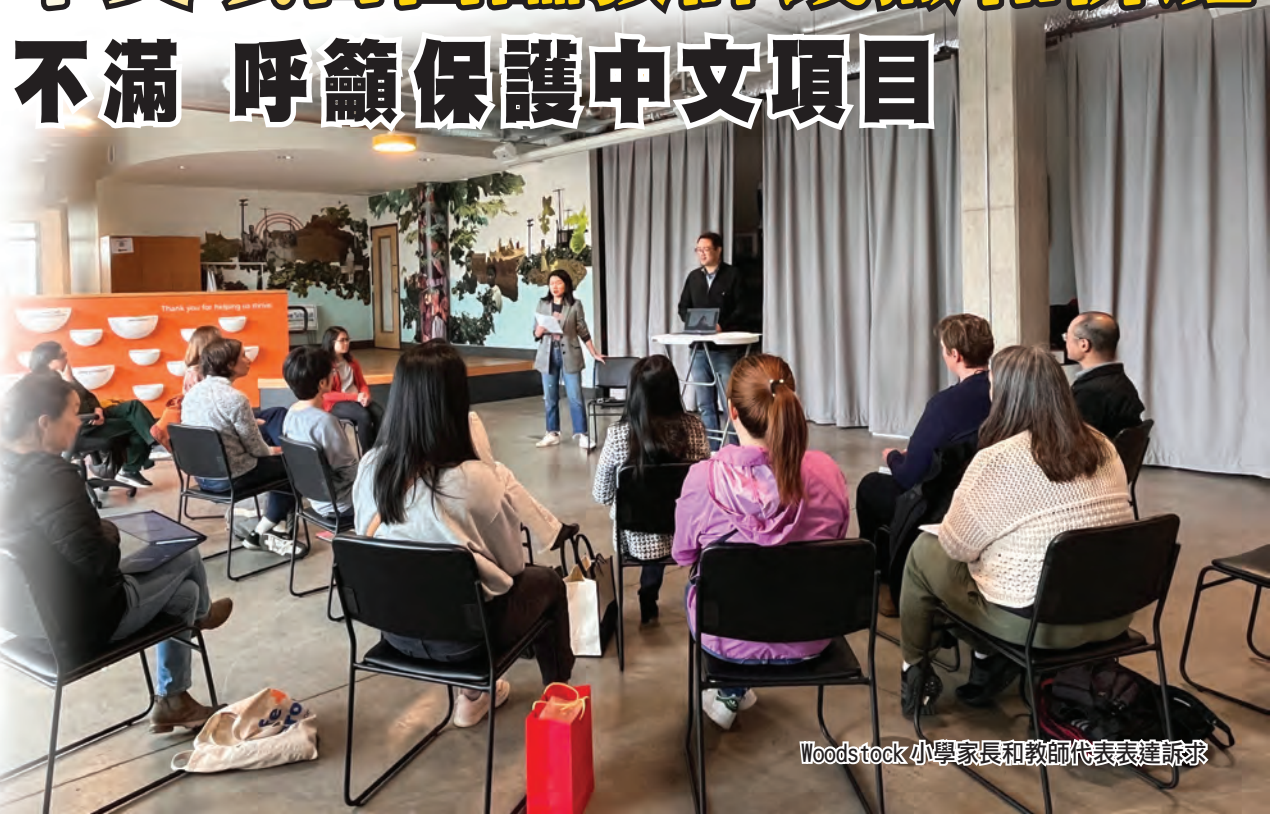
Woodstock 小學家長和教師代表表達訴求